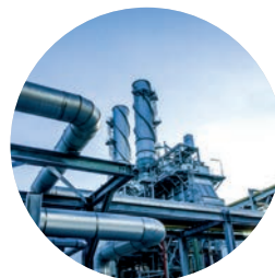
Procédés et technologies