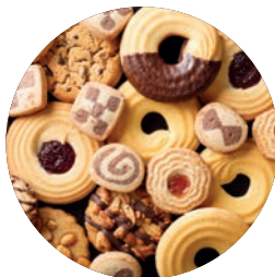
Alimentation humaine et animale